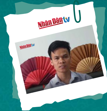
Truyền hình VTV1, ANTV, TH Nhân dân đưa phóng sự